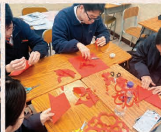
師生投入剪紙創作