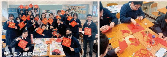
學生投入書寫揮春