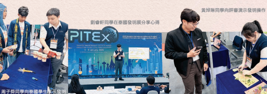
黃焯琳同學向評審演示發明操作