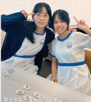
學生手製非遺食品黏土模型