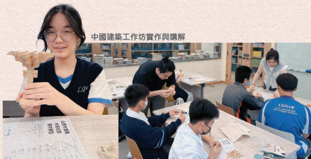
中國建築工作坊實作與講解

活動以生動形式引導學生探索非遺價值，不僅提升學習興趣，更強化對本土與國家文化的認同與傳承意識。