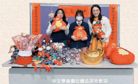
中文學會攤位禮品深受歡迎