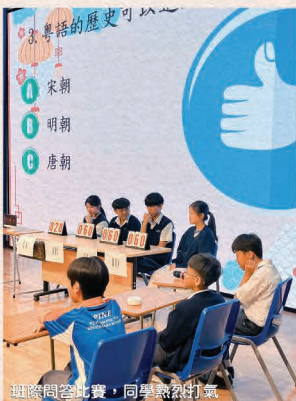
班際問答比賽，同學熱烈打氣