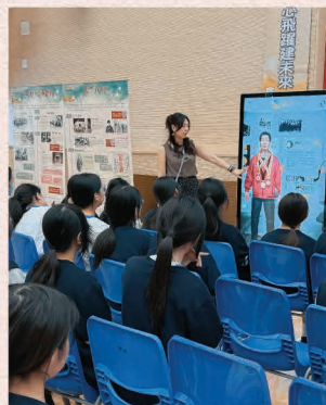
學生參與AI抗戰志士互動巡演