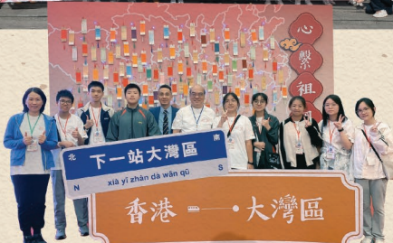
▲ 難得兩位校長一起支持交流團，當然要來張大合照