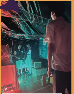
場景非常逼真，令人不寒而慄！你有膽量挑戰嗎？