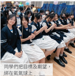
同學們把目標及期望，綁在氫氣球上