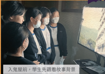
入鬼屋前，學生先觀看故事背景