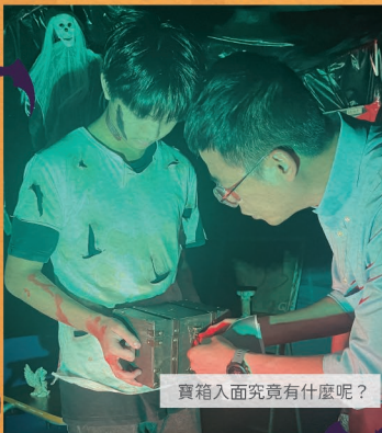
寶箱入面究竟有什麼呢？