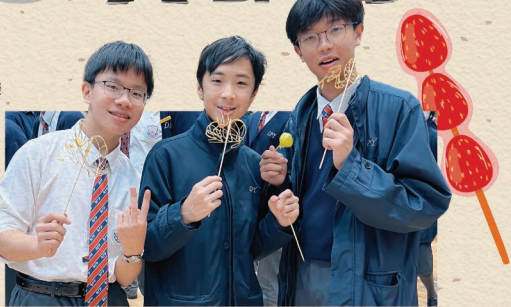
▲ 同學們開心嘗糖畫