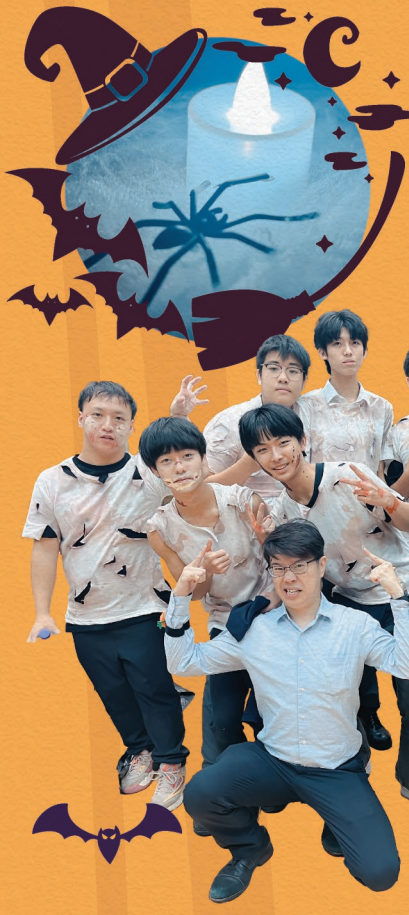
▲ 學長會的負責老師及扮鬼的工作人員

萬眾期待的學長會鬼屋今年終於復辦！由輔導組學長會親自策劃及籌辦的鬼屋「詭校疑案」吸引了大批學生參與，當中有沒有你的影子呢？當天學校禮堂搖身一變成為鬼屋，設有美術室、音樂室、課室等不同場景，參與的同學需要透過不同場景的線索，協助破案，尋找真兇！