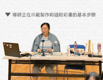
▼導師正在示範製作和諧粉彩畫的基本步驟

為了讓學生學習欣賞生命，常存感恩，本校特別為中四級舉辦和諧粉彩治療工作坊。同學在治療師的帶領下，學懂欣賞萬物，從而創造出精美的粉彩畫，並從中學懂如何釋放個人壓力。