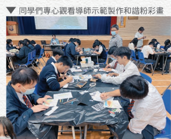
▼同學們專心觀看導師示範製作和諧粉彩畫