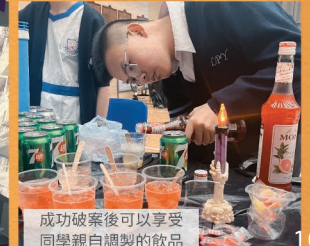
成功破案後可以享受同學親自調製的飲品