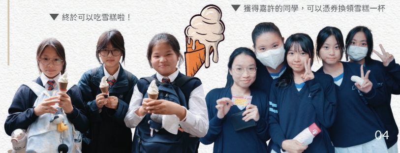
▼獲得嘉許的同學，可以憑券換領雪糕一杯