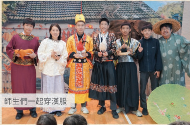
▲ 師生們一起穿漢服