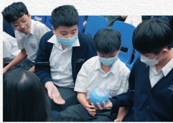
▲同學能親手感受草地滾球的重量