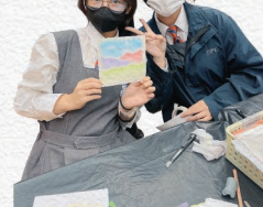
▲同學樂於分享畫作